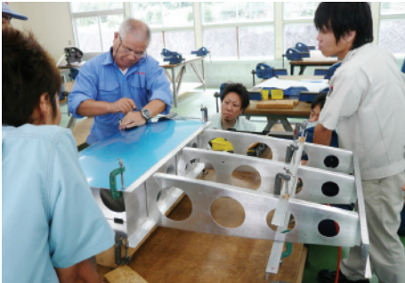
講師は各分野のスペシャリストで構成。学界または産業界からの現役・OBの方々による講義が受けられます。