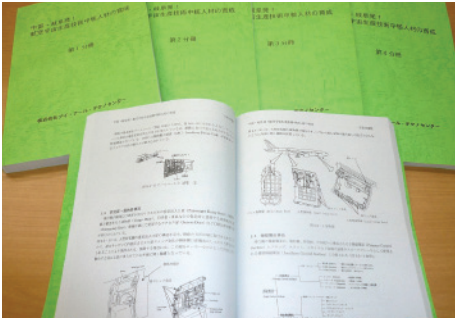
各分野のスペシャリストにより作成。平成20年度実証講義を実施し、更なるグレードアップ!