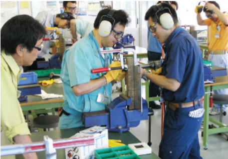
ベテラン講師による指導の基、実際の航空機部品(翼部分)を作成して頂きます。