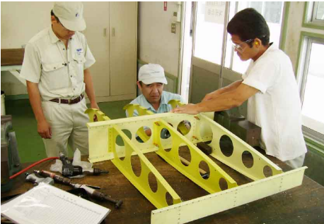
ベテラン講師による指導の基、実際の航空機部品（翼部分）を作成して頂きます。