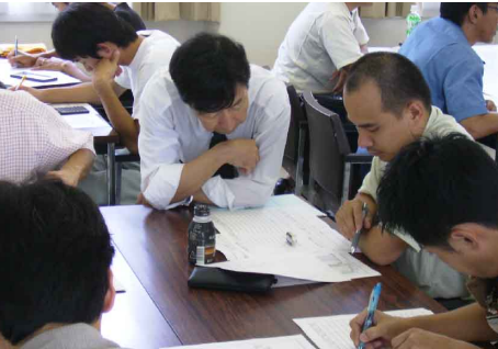
講師は各分野のスペシャリストで構成。学界または産業界からの現役・OBの方々による講義が受けられます。